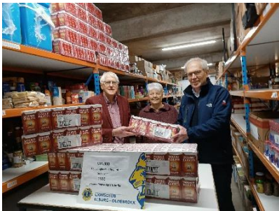
1550 pakken DE koffie.

De Lions Club Elburg - Oldebroek heeft voor de Voedselbank een inzamelactie van Douwe Egberts-waardepunten gehouden.