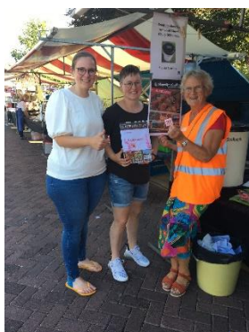
De activiteitencommissie op een markt.

Ook werd op elke markt een passieve donateurswerfactie gehouden.