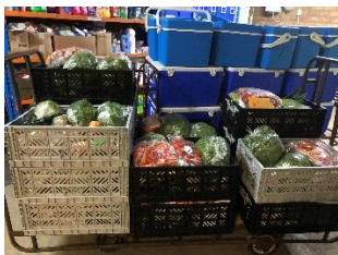
Klaar voor transport naar Wezep.

Op dinsdagmiddag zorgden de vrijwilligers voor het vullen van de kratten en de koelboxen en de uitgifte van de voedselpakketten bij het uitgiftepunt te Wezep en bezorging in Oldebroek.