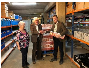
2188 pakken DE koffie.

De Lions Club Elburg - Oldebroek heeft voor de Voedselbank een inzamelactie van Douwe Egberts-waardepunten gehouden.