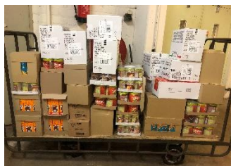
Transport van binnenkomende goederen.

De chauffeurs gingen op maandag-, dinsdag-, donderdag- en vrijdagmorgen naar de leveranciers om daar de goederen op te halen.