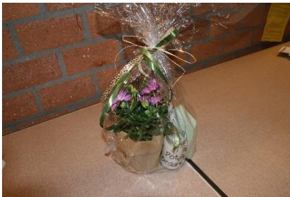
De attentie voor de vrijwilligers van beide gemeenten.

Het bestuur is de vrijwilligers zeer erkentelijk voor de gemotiveerde wijze waarop zij zich inzetten voor de voedselbank. Als waardering daarvoor kon de jaarlijkse vrijwilligersavond gelukkig weer worden gehouden. Er namen 52 vrijwilligers inclusief partners aan deel.