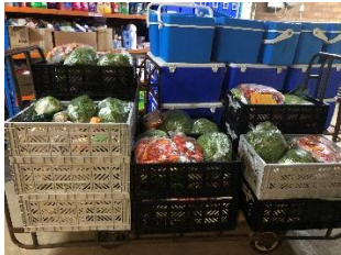
Klaar voor transport naar Wezep.

Op dinsdagmiddag zorgden de vrijwilligers voor het vullen van de kratten en de koelboxen en de uitgifte van de voedselpakketten bij het uitgiftepunt te Wezep en bezorging in Oldebroek.