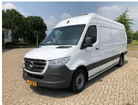
De nieuwe auto.

Voor het vervoer maakte de Voedselbank tot het voorjaar gebruik van de eind 2015 nieuw gekochte Mercedes Benz koelauto. Die aanschaf werd toen mede mogelijk gemaakt door de bijdragen van de Rotary Club, Het Rabofonds van Rabobank Noord Veluwe, de organisatie van voetbaltoernooi de Veluwecup, Prins Bouw uit 't Harde, Will2Sustain te Oldebroek, Citybar Elburg, Voetbalvereniging ESC en Stichting De Zevende Bazuin. Ook van particulieren ontvingen we bijdragen voor de aanschaf van de koelauto. Sinds voorjaar 2021 hebben we een nieuwe koelwagen, een Mercedes Sprinter, die uit eigen middelen kon worden betaald.