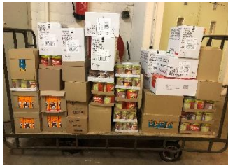
Transport van binnenkomende goederen.

De chauffeurs gingen op maandag-, dinsdag-, donderdag- en vrijdagmorgen naar de supermarkten om daar de goederen op te halen.