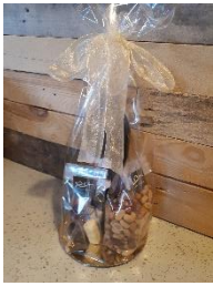
De attentie voor de vrijwilligers

Het bestuur is de vrijwilligers zeer erkentelijk voor de gemotiveerde wijze waarop zij zich inzetten voor de voedselbank. Door de Coronamaatregelen kon helaas de traditionele vrijwilligersavond niet plaatsvinden.