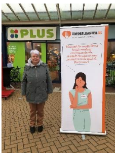
Aandacht voor de winkelacties.

De winkelactie "Op een lege maag kun je niet leren" bij Albert Heijn in Nunspeet heeft ons en Voedselhulp in Nunspeet, elk dertig bananendozen vol met ontbijtproducten opgeleverd.