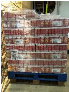
Een pallet vol DE koffie.

De Lions Club Elburg - Oldebroek heeft voor de Voedselbank een inzamelactie van Douwe Egberts-waardepunten gehouden.