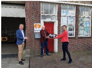
Wethouders bieden een taart aan.

Het nieuwe HACCP certificaat hadden we dan ook al binnen een week binnen.