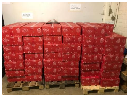
Ontvangen kerstpakketten van een bedrijf.

De Radio 538-dj's gingen leuke, gekke, bizarre en grappige uitdagingen aan om zoveel mogelijk geld op te halen voor de voedselbank. Luisteraars konden ook een bod uitbrengen om hun favoriete plaat op de radio te krijgen.