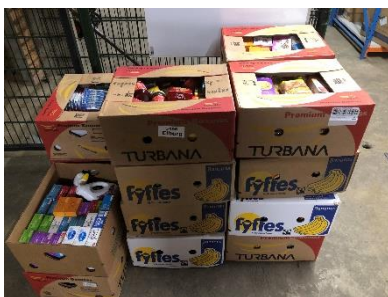
Resultaat van een inzameling.

Door de coronacrisis kwamen de traditionele wekelijkse, maandelijkse en kwartaalinzamelingen bij de diverse kerken grotendeels te vervallen.