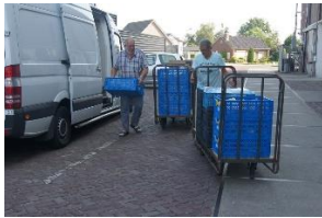
Transport van binnenkomende goederen van de supermarkten.

Twee chauffeurs gingen tot 1 oktober iedere morgen naar de supermarkten om daar de goederen op te halen. Vanaf 1 oktober werden daar de goederen op maandag-, dinsdag-, donderdag- en vrijdagmorgen opgehaald.