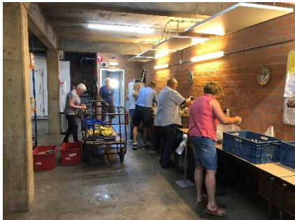
Sorteren en opruimen van binnenkomende goederen.

Op woensdagmorgen was er dan ook een schoonmaakteam. Dat team zorgde ervoor dat alle kratten en koelboxen gereinigd werden, de vloeren werden geschrobd en de voedselbank goed werd schoongehouden.