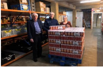
Lionsclub overhandigt de koffie.

Mensen konden in diverse supermarkten waardepunten van Douwe Egberts inleveren. Bij inlevering van die waardepunten (831.243 ) bij Douwe Egberts, kreeg de Voedselbank daar 1736 250-grams pakken koffie voor. De koffie was een waardevolle toevoeging voor onze voedselpakketten, omdat we nauwelijks koffie van leveranciers ontvingen.