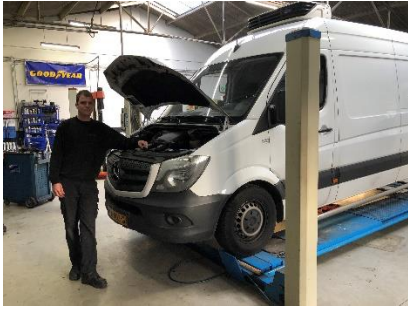
Gratis onderhoudsbeurt van de auto.

De hulpdienst van de ANWB verleende de auto's van de voedselbanken gratis hulp bij pech onderweg. Van deze hulp hebben we gelukkig geen gebruik hoeven maken. Boven de sorteertafels hangen verwarmingselementen aan het plafond, die wij in 2015 gesponsord hebben gekregen, waardoor het op die plaatsen een beetje kon worden verwarmd.